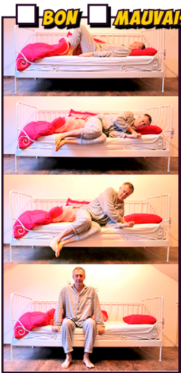
Se lever du lit

Cochez au plus vite la bonne solution et donnez la feuille au superviseur.