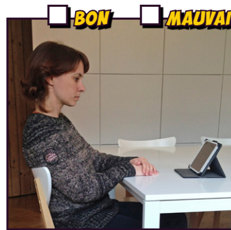
Travailler sur la tablette