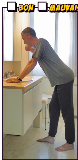
Se laver les dents