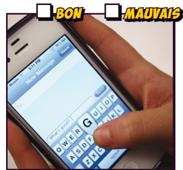
Envoyer des SMS (avec l pouce)