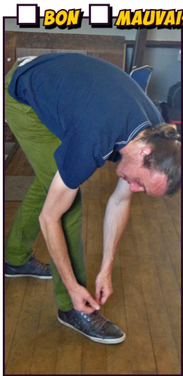
Lacer ses chaussures