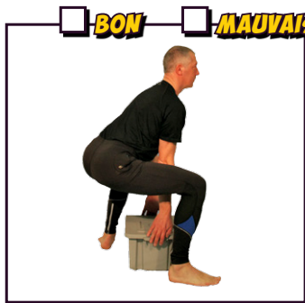
Soulever un objet lourd