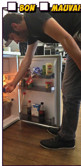
Sortir une bouteille du réfrigérateur